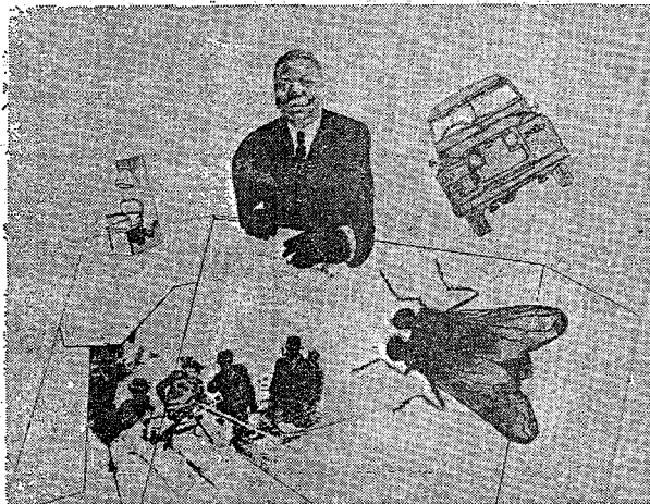
Een van de 'Dagboekbladen' van Claus dat deel uitmaakt van een op de actualiteit gerichte tentoonstelling die binnenkort in Gent wordt geopend.

In deze 'Dagboekbladen' worden ook Franco en de cierus gestriemd. Claus verwacht er wel weer moeilijkheden over in België dat hem of niet kent of afwijst.