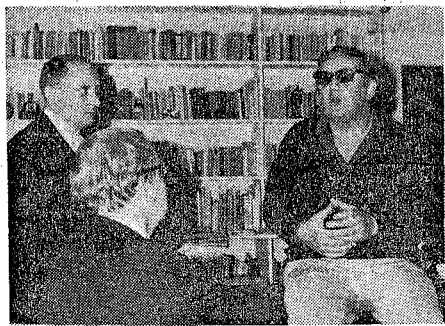
Hugo CLAUS: « Men kan een beweging niet stopzetten... »

— Vroeger kon men gemakkelijker een vergelijking trekken tussen jazz en ontspanningsmuziek. Nu lopen beide vormen geheel uit elkaar. De business draait nu zeer intens omheen de hedendaagse ontspanningsmuziek. Men biedt de jeugd eenvoudige wijsjes aan. Het beluisteren van jazz daartegenover stelt andere eisen. Jazz is een serieus fenomeen. Johnny Halliday en Elvis Presley zijn vertrouwde namen. De teenager koopt een opname van hen, speelt ze twaalf