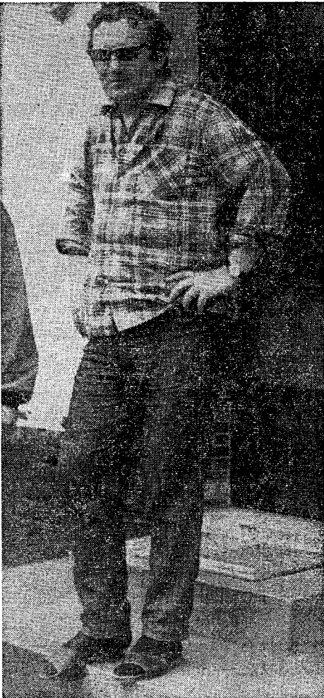
(Van een onzer redacteuren)

In september komt een nieuwe roman uit: Schaamte. De meeste mensen gaan gebukt onder een schaamte-erfenis, o.m. door het christendom beïnvloed. Ik kan mitspreken over erfenissen uit het verleden.