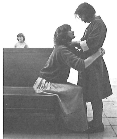
Stella (Theater Vertikaal)