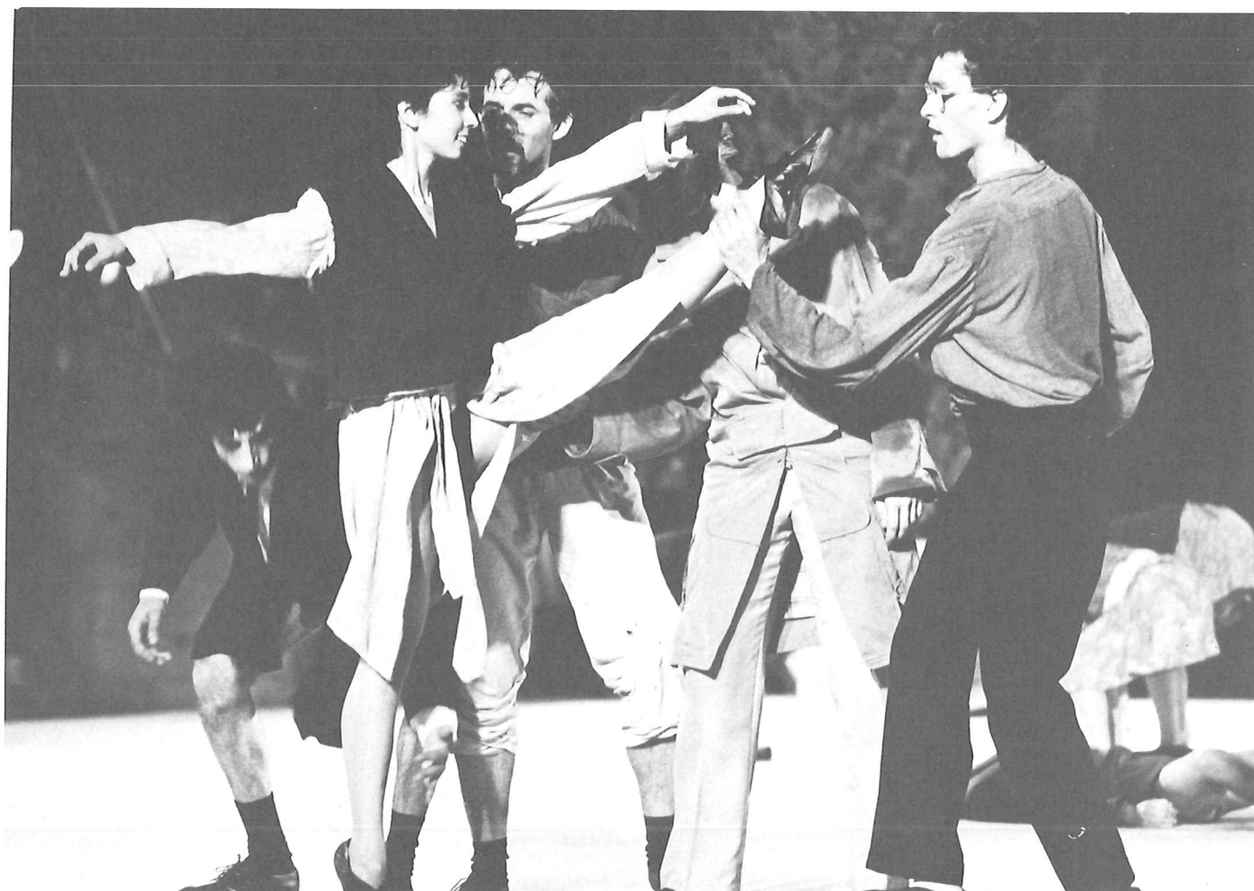
Boven: Les Survivants – Groupe Emile Dubois – Foto Maurin