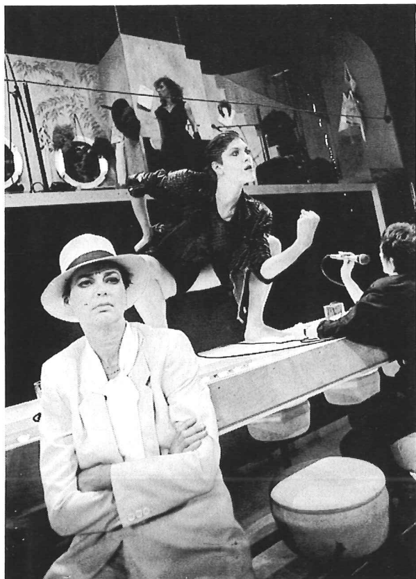
Bakeliet – Toneelgroep Amsterdam