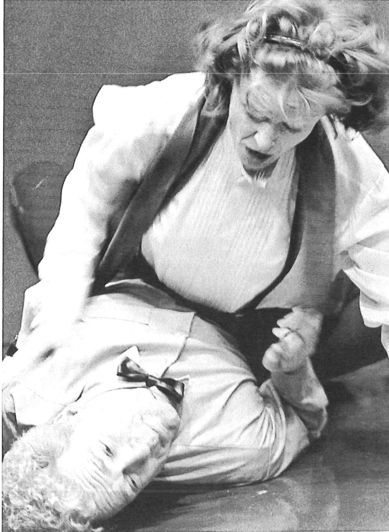
Hitchcock's Driesprong – Art & Pro