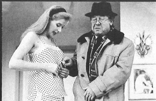
'Figues après Noël' — Théâtre des Galeries