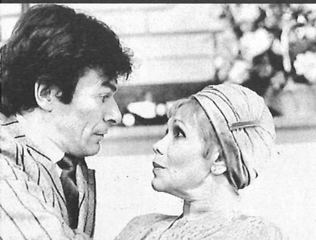
'Faisons un rêve' Théâtre Royal du Parc