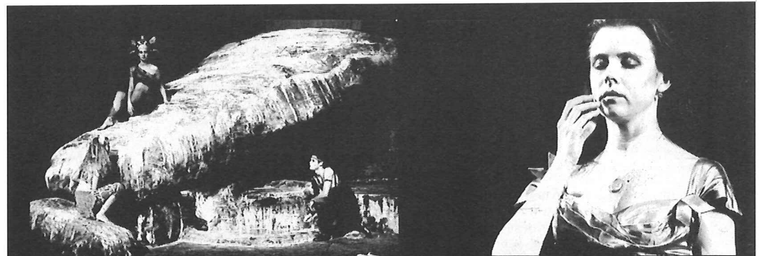
'Renaud et Armide' Les Tréteaux