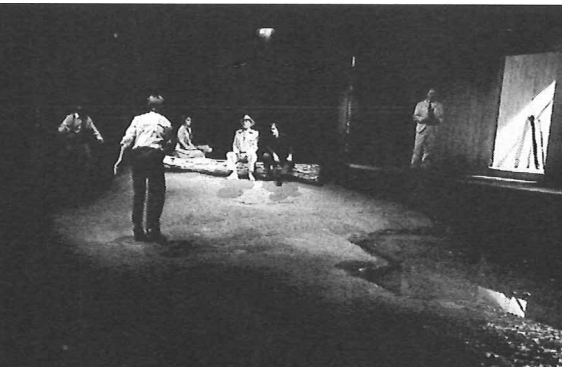
'Les Estivants' Atelier Rue St-Anne