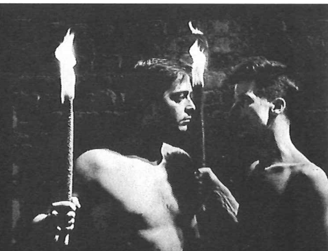
'Britannicus' Théâtre de la Vie