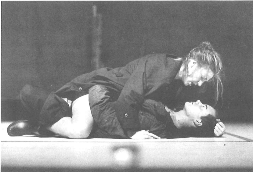
Thyestes, Het Zuidelijk Toneel / H. Sorgeloos