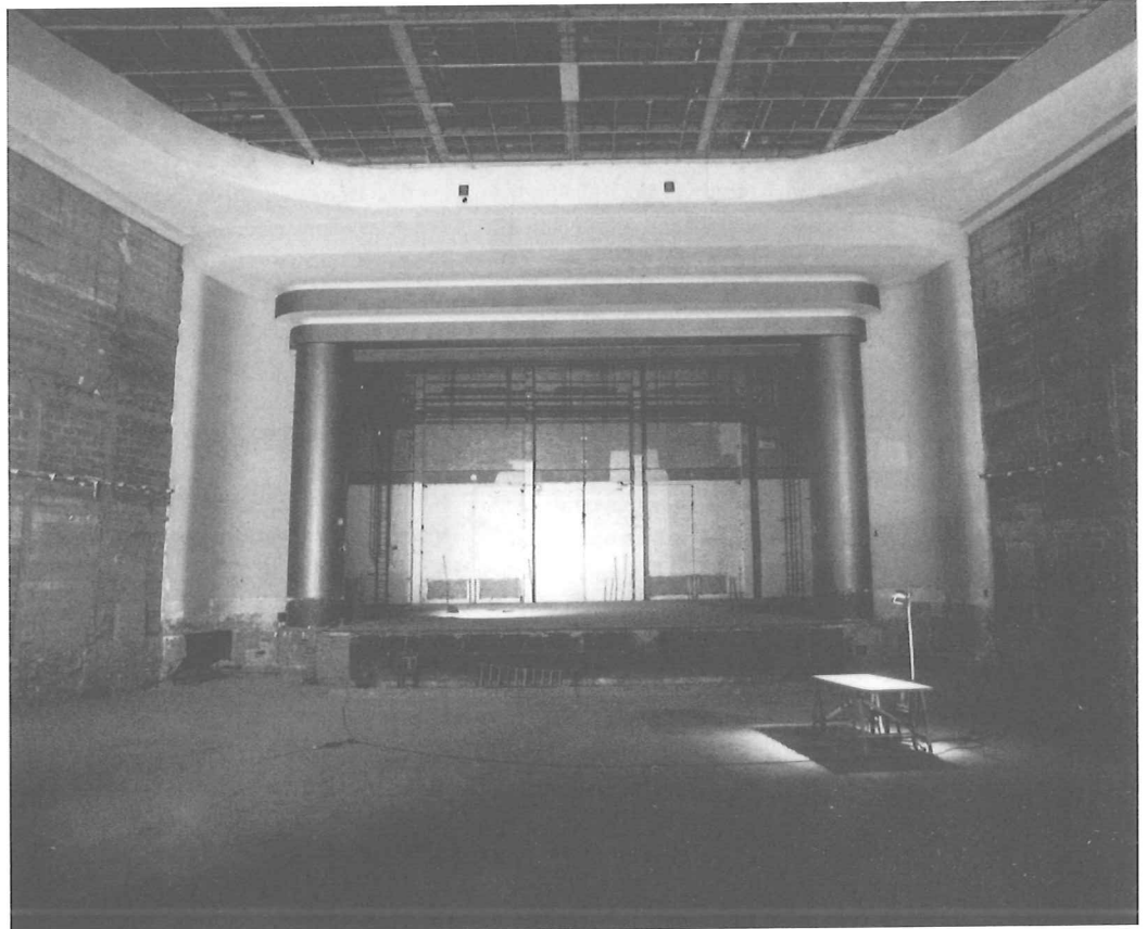
ABC/La Luna / Frank Goethals

Naast deze 'gevestigden' kunnen we voor de vuist weg - alleen al in Vlaams Brussel - een reeks eerder kleinschalige initiatieven noemen die met gerichte, kwalitatieve en kwantitatieve, injecties gebaat zouden zijn. De Markten liggen in hartje Brussel. De ruimtes zijn nagenoeg zonder middelen verbouwd tot een centrum waar in de eerste plaats het sociaal-cultureel werk onderdak vindt. Maar tegelijk biedt de infrastructuur onderdak aan plastische kunstenaars en theatermakers. Geef De Markten iets meer middelen om de infrastructuur en het personeelsbestand te optimaliseren. En het kan perfect functioneren als eerste opvang voor o.a. debuterende artiesten die vooral op zoek zijn naar logistieke ondersteuning. Min of meer hetzelfde verhaal kan je doen over trefcentrum De Pianofabriek