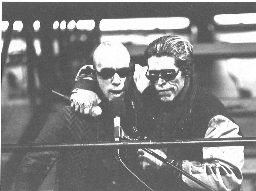
The Hairy Ape - The Wooster Group / Mary Gearhart