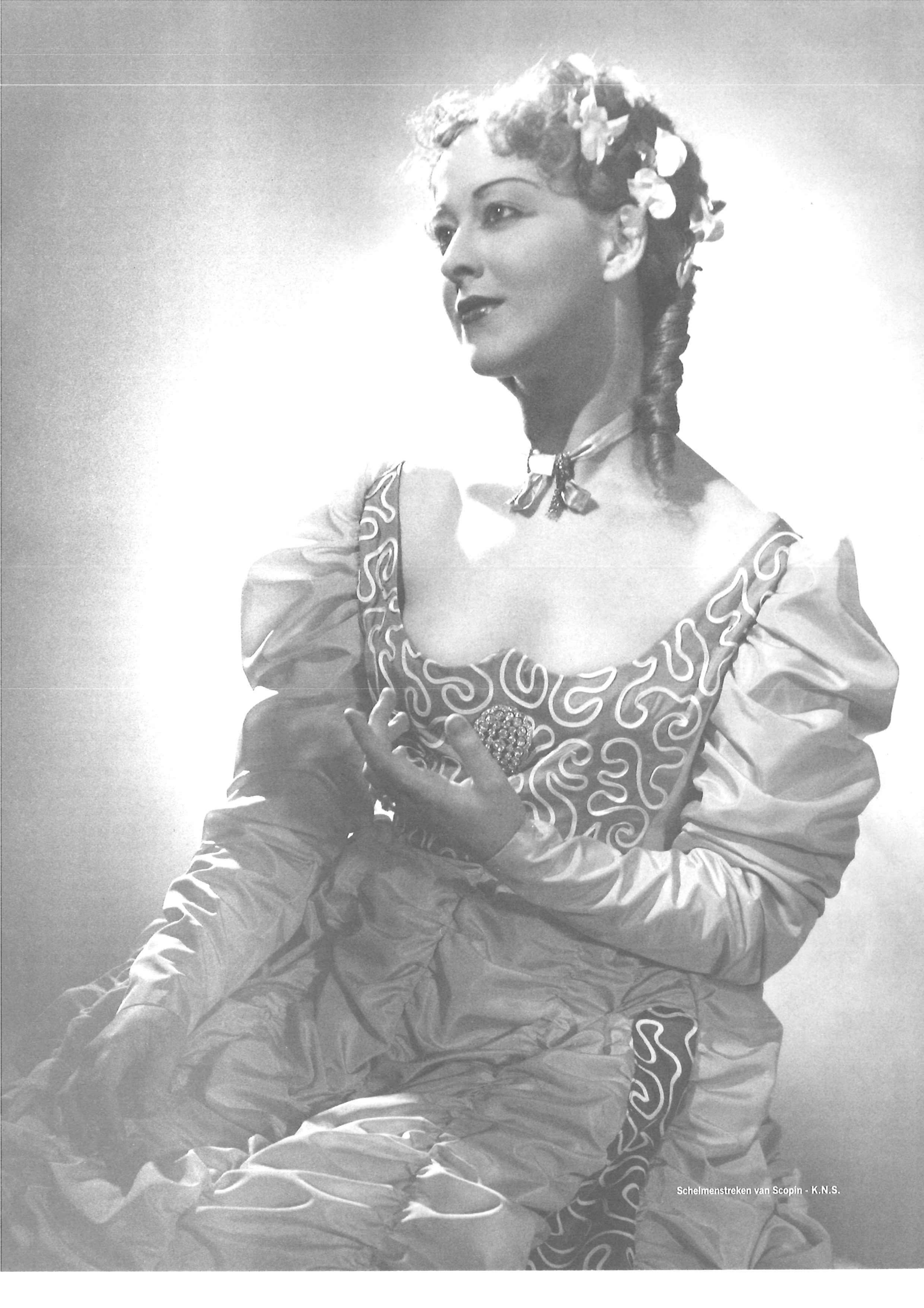
Schelmanstreken van Scopin - K.N.S.