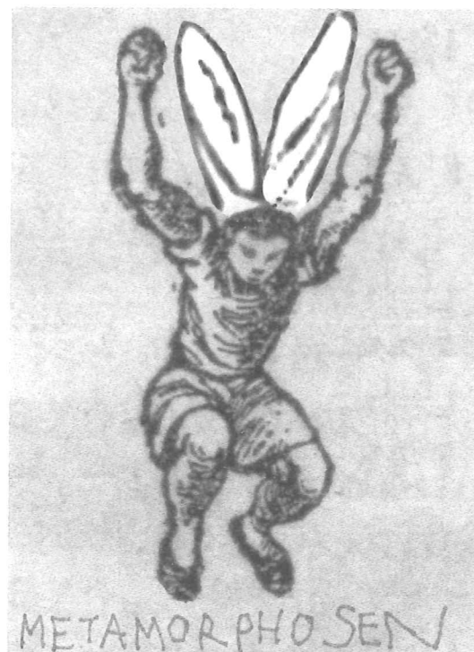
Metamorphosen TEKENING BENJAMIN VERDONCK

EGERIA VERANDERT IN EEN BRON HECUBA VERANDERT IN EEN JANKENDE HOND HERIA VERANDERT IN EEN VIJVER HIPPOMENES VERANDERT IN EEN LEEUW HYACINTHUS VERANDERT IN EEN BLOEM IO VERANDERT IN EEN KOE IPHIS VERANDERT IN EEN MAN LYSISCHE BOEREN VERANDEREN IN KIKKERS LEUCOTHOE VERANDERT IN EEN WIEROOKSTRUIK LICHAS VERANDERT IN EEN ROTS MYRRHA VERANDERT IN EEN BOOM NIOBE VERANDERT IN EEN ROTS NYCTIMENE WORDT IN EEN UIL VERANDERD PERDIX VERANDERT IN EEN PATRIJS PHILOMENA VERANDERT IN EEN ZWALUW PICUS VERANDERT IN EEN SPECHT SEMIRAMIS VERANDERT IN EEN DUIF SIRENEN VERANDEREN IN VOGELS MET MEISJESHOOFDEN STELLIO VERANDERT IN EEN HAGEDIJ SYRINX VERANDERT IN MOERASRIET