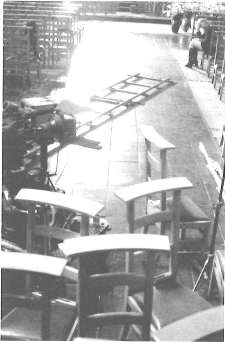
Tournage in Brussel