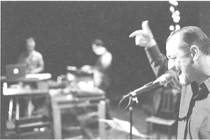
Die siel van die mier HET MUZIEK LOD & HET NET