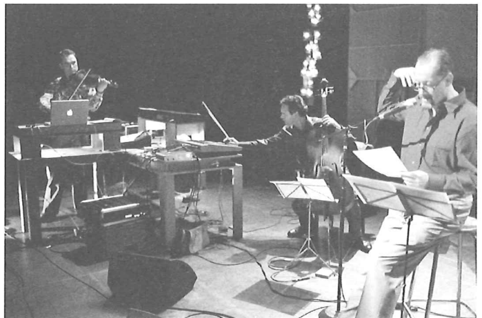
Die siel van die mier HET MUZIEK LOD & HET NET

Van muziek die live en zonder foefjes op het podium uitgevoerd wordt, mag je ten minste verwachten dat ze op eigen benen kan staan. Dat durft nogal eens tegenvallen in deze voorstelling. Hoeveel gejaagde 'soul' er ook in de vezels van deze muziek kruipt, een eigen 'siel' heeft ze alvast niet. Twee redenen hiervoor. In de eerste plaats werkt deze theatermuziek al te onderdanig en functioneel. Ze wordt stevast ingezet op drie traditionele, nogal uitleggerige niveaus: als illustratieve muziek ter