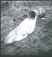
Robert Smithson, Glue Poor , 1969

de jaren zeventig maar wel altijd op haar tijd vooruit. Misschien heb je gelijk. Misschien is het gewoon mijn persoonlijke ommezwaai van grafieken naar vloeistoffen. Het is mogelijk om beide manieren te vermengen: vloeistof-